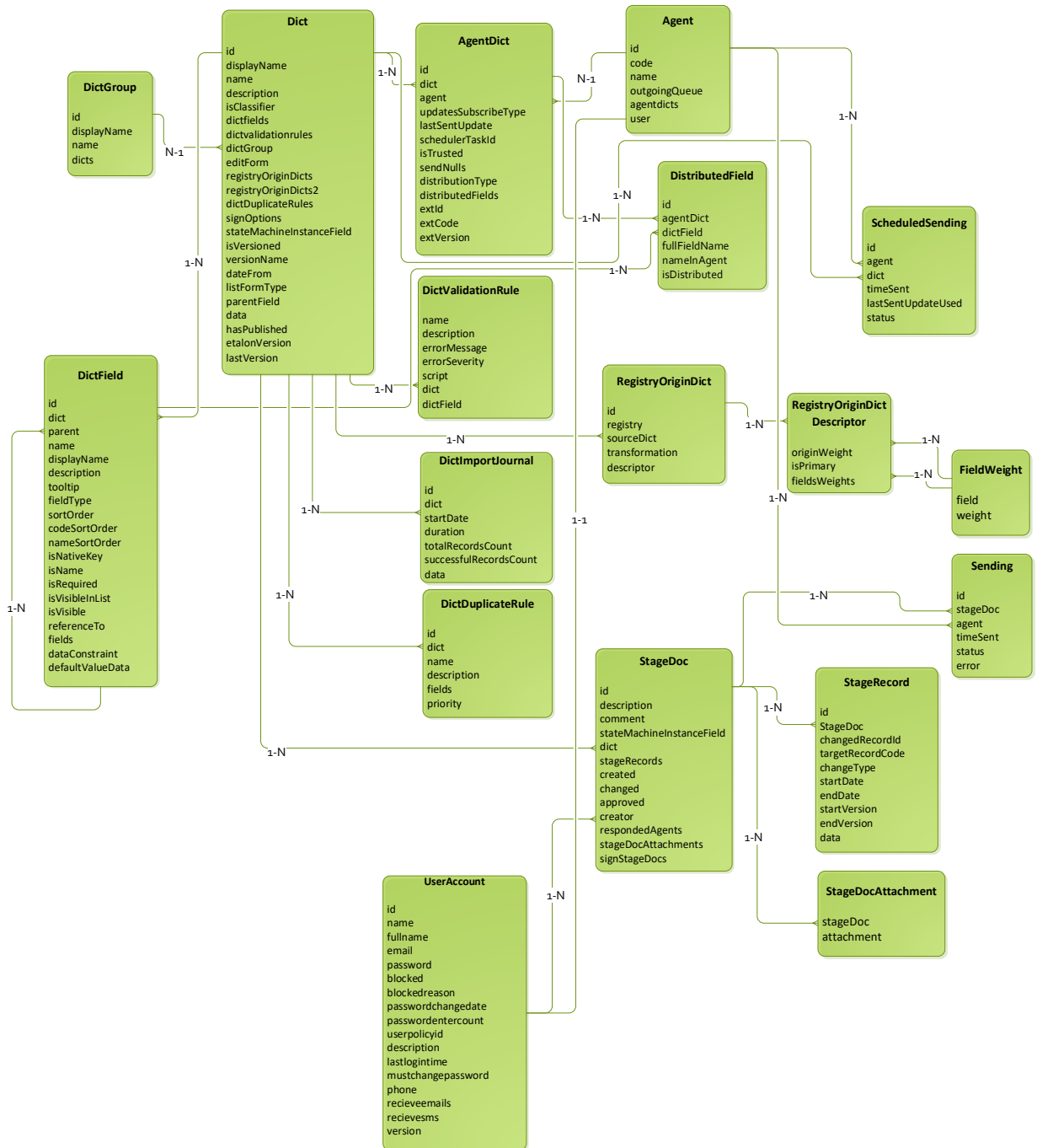
Рисунок Б.1 – Схема логической структуры БД

Логическая структура БД представлена на рисунке Б.1.